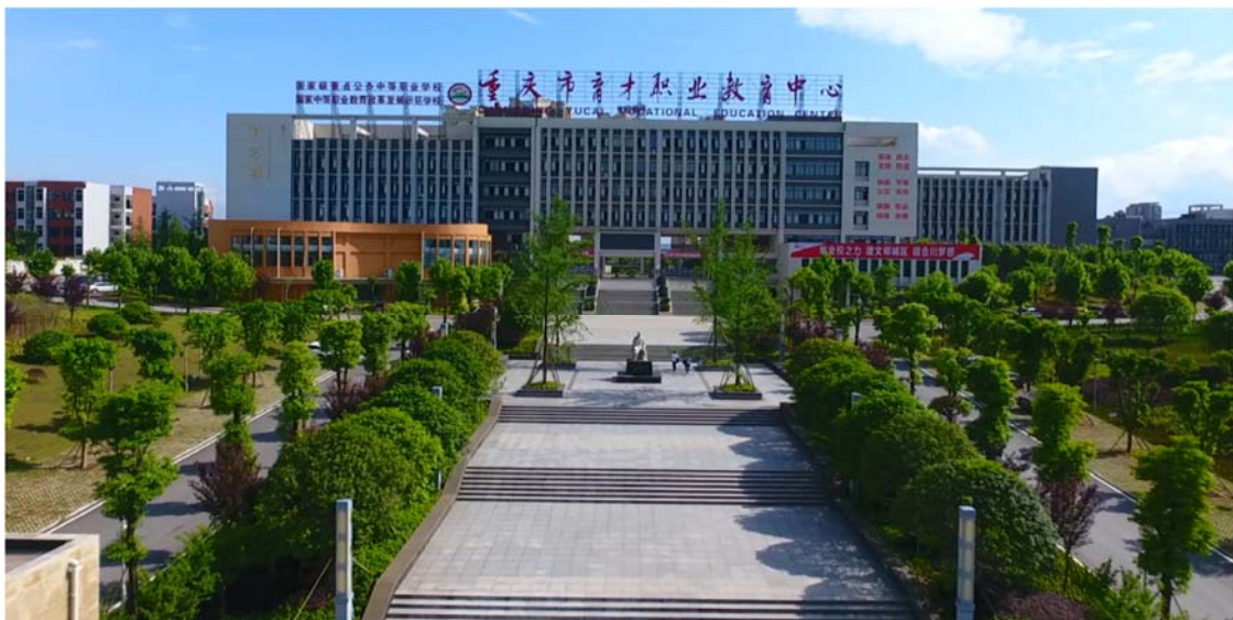
学校陶行知广场照片

重庆市育才职业教育中心于 1984 年在陶行知夫人吴树琴女士及部分育才学校老校友的倡导下创办，是一所践行陶行知教育思想的中等职业学校，是重庆市陶行知研究会“实验学校”。学校由重庆市合川区人民政府主办，重庆市合川区教育委员会主管，是“国家级重点中等职业学校”、“国家级中等职业教育改革发展示范学校”、“国家标准化考场”。学校占地 214573.9 平方米，建筑面积 98235.7 平方米，固定资产 2.5129 亿元。