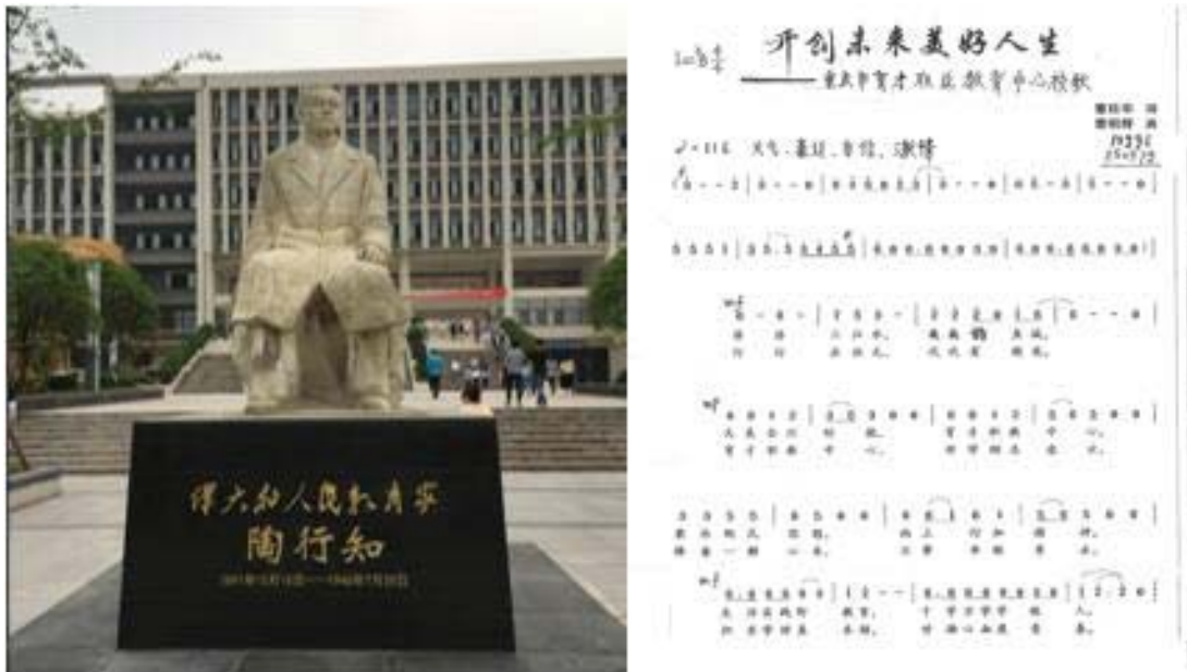
学校陶行知先生塑像及校歌曲谱

研究会合作完成《行知校园文化制度建设报告——走向有章可循、依法治教的学校发展》。