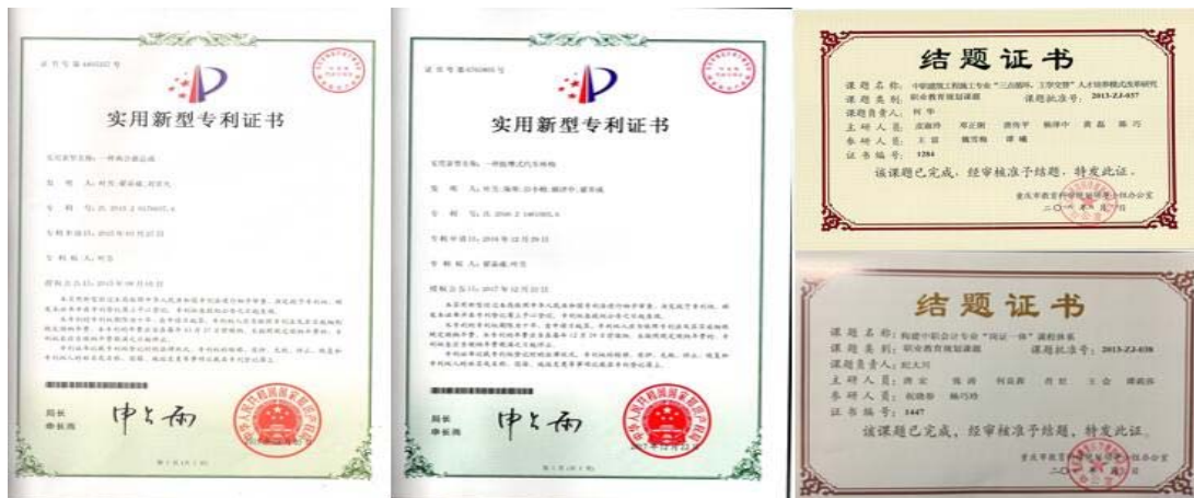
部分专利证书与结题证书

科研能力、课堂教学能力、专业技术能力、班主任工作能力的发展。经过两年的培养，工作室教师四个方面的能力得到迅速提升。共申请发明专利 4 项；主持市级课题研究 9 项；公开发表论文 68 篇；公开出版教材 5 本；获取职业资格证书 13 个；教师在技能大赛、说课赛课、班主任基本功竞赛中获国家级奖项 9 人次，市级奖项 26 人次，区级奖项 18 人次，校级奖项 20 人次。能力的提升带来了教师专业的全面发展，近两年来，工作室教师学历提升 9 人，其中 1 人考取教育博士，1 人考取教育硕士，7 人获得或进修第二本科学历；职称提升 5 人，其中 2 人晋升为高级职称。