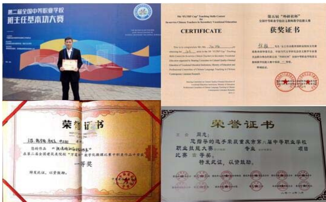
部分工作室学员参加比赛获奖