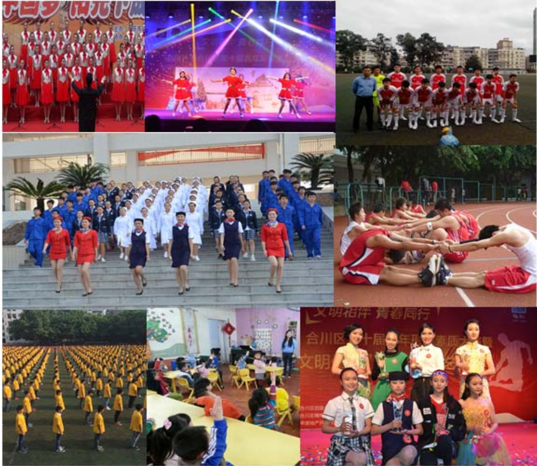
学生在校学习生活情况