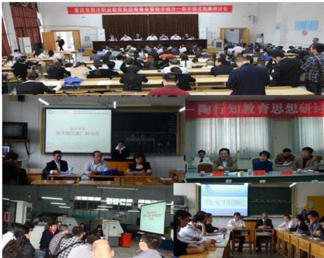
“教学做合一”教学模式改革相关活动