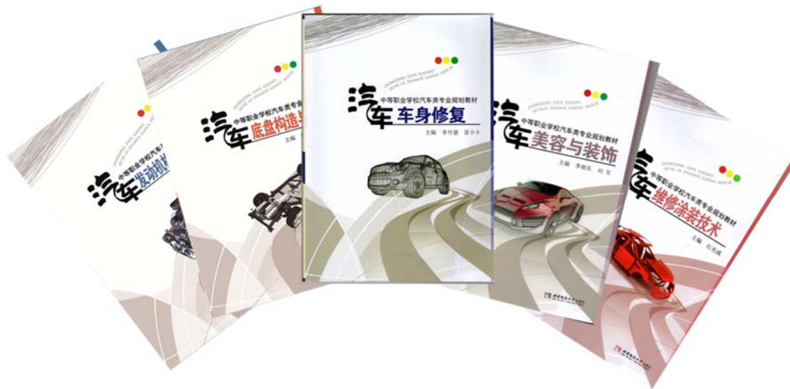
图 4 开发教材

学校高度重视教学资源开发工作。本学年度学校与企业共同开发《汽车发动机构造与维修》、《汽车底盘构造与维修》2 门精品课程，公开出版了《汽车车身修复》等教材 5 本，开发 PPT 课件 513 个，录制微课件 38 个，制作课堂实录 49 堂，建设试题库 17 个。本学年度，学校建筑工程施工专业继续参与了由重庆市中职学校土木水利类专业教学指导委员会牵头的资源共建共享，统编了本专业的教材，筹备开发相关课程的数字化教学资源。