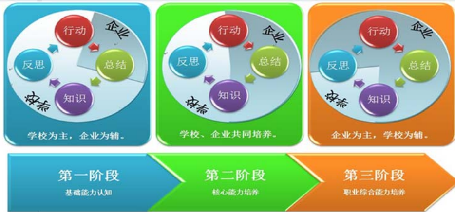
图 3 “知行合一、工学结合”人才培养模式