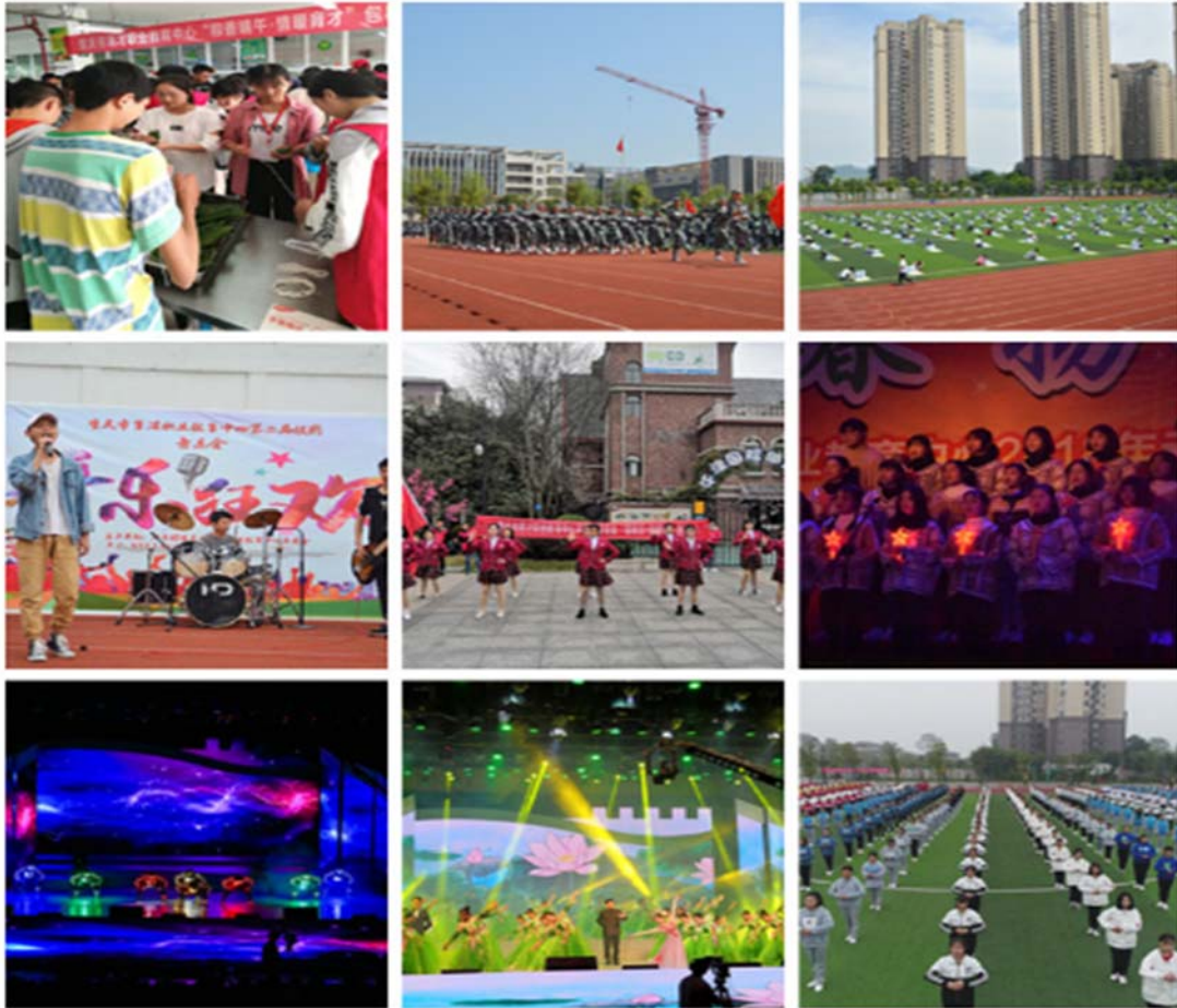
图1 学生在校学习生活情况