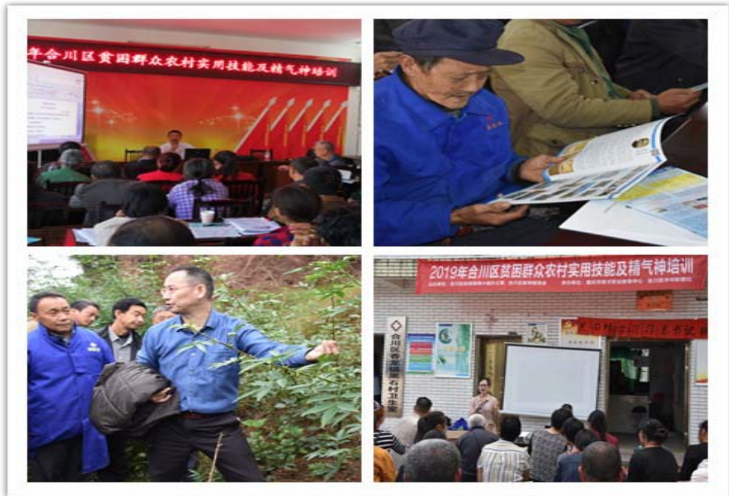
图 8 扶贫培训

生 226 人，涉农学生 75 人，连片贫困地区 152 人，其它家庭经济困难学生 871 人，资助金额共计 1772.84 万元。