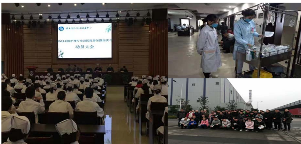
图 3 岗前培训

学校高度重视学生职业发展指导与培训工作。在学生入学第一学年开设了《职业生涯规划》、《职业道德与法律》2 门德育课程。本学年度，学校开展装配工、操作工等岗位的岗前培训共 632 人次，开展各专业实习指导共 632 人次，开展各专业毕业生就业指导共 1880 人次，开展“大众创业、万众创新”系列教育培训讲座 1200 人次，开展“微型企业法律法规定讲座” 3000 人次。在 2018 年重庆市中等职业学校创业设计竞赛活动中，学校学生共获 2 个一等奖。