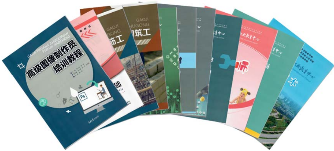
图 6 公开出版教材、开发校本教材