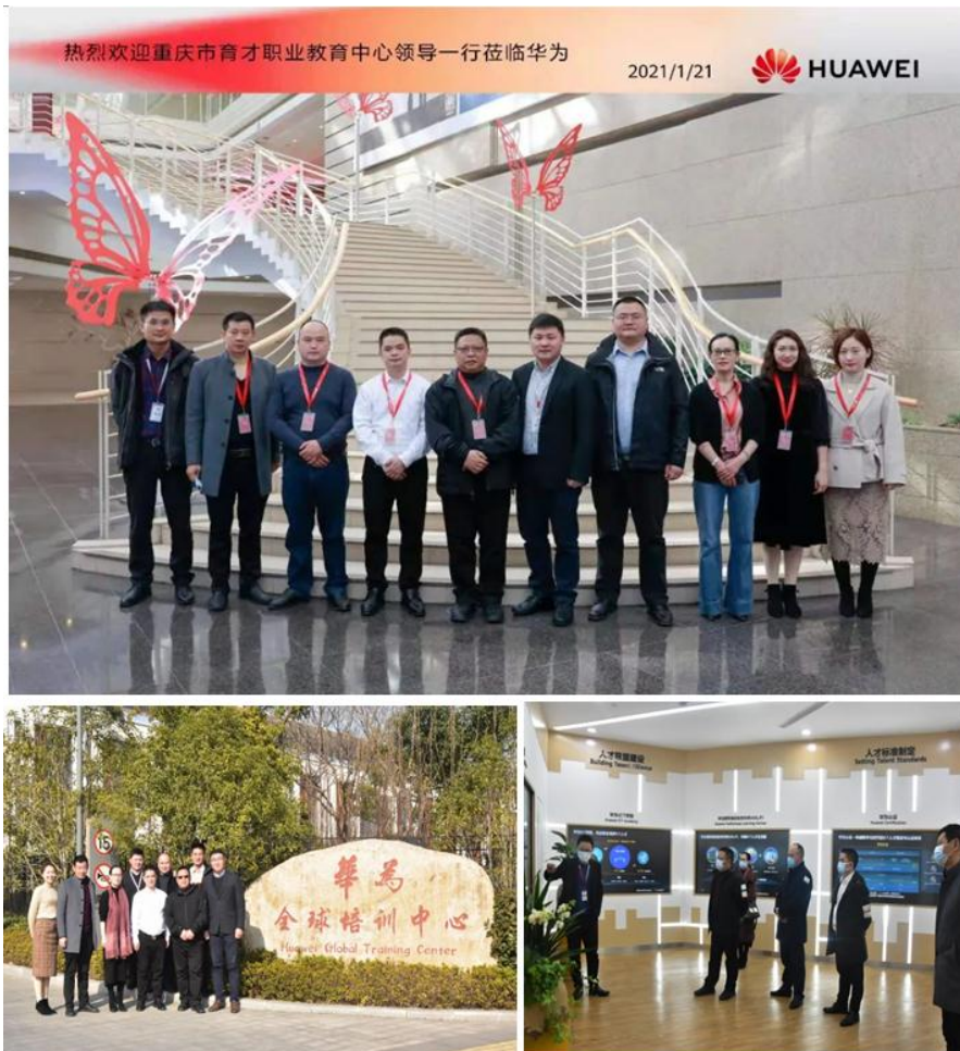
图 12 学校领导赴华为考察