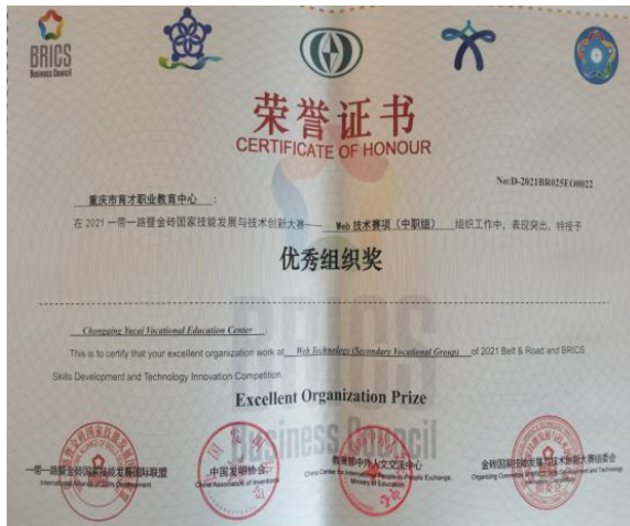
图 2 一带一路暨金砖国家技能发展与技术创新大赛“优秀组织奖”

学校先后获得一带一路暨金砖国家技能发展与技术创新大赛“优秀组织奖”、全国中等职业学校“文明风采”竞赛活动优秀组织奖、参加全国院校技能（中职组）大赛十年成就奖、重庆市教学成果奖、重庆五一劳动奖状等市级以上重要荣誉 20 多项。学校牵头成立的重庆市育才职业教育集团被评为重庆市中等职业教育示范性职业教育集团，学校多次获评为重庆市、合川区中职招生工作先进单位，获评合川区“中华魂”优秀组织奖，学校领导班子多次在年度考核中荣获“优秀领导集体”的殊荣。本学年来，1 名教师参加全国乡村振兴职业技能大赛获得银牌，2 名教师指导学生获得全国职业院校职业技能大赛中职组建筑装饰项目国赛一等奖，1 名教师获得重庆市特级教师。