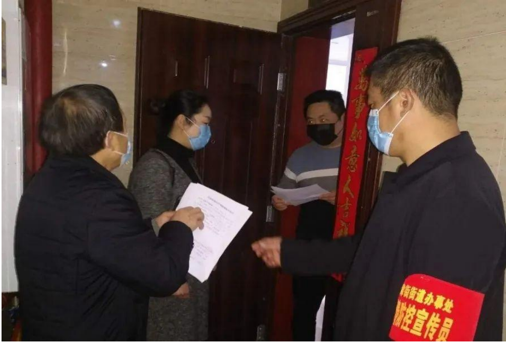
图 21 学校党员同志进行疫情防控宣传