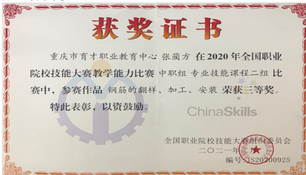
图 16 教师教学能力比赛国赛三等奖证书

本学年度，教师总共获奖 23 项。其中，参加 2020 年重庆市中等职业学校职业技能大赛教师教学能力比赛获奖 8 项；参加重庆市第二届老年教育微型课程比赛获奖 2 项；参加重庆市第十三届中等职业学校技能大赛获奖 13 项。