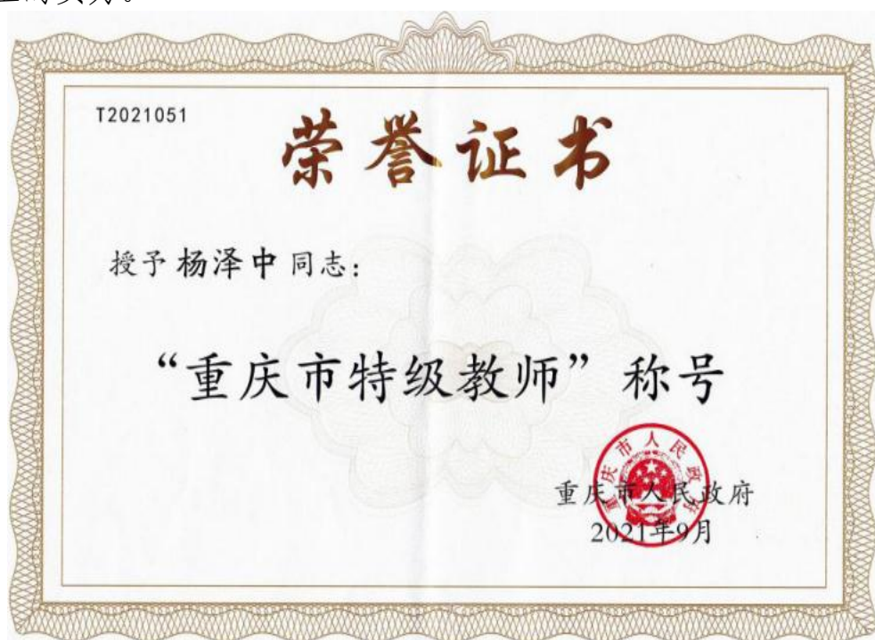
图 10 杨泽中获重庆市特级教师称号

二是培养骨干教师。学校出台了《重庆市育才职业教育中心骨干教师管理办法》，通过选拔、培训、参赛等举措，培养骨干教师 52 名。其中，市级骨干教师杨泽中被评为重庆市特级教师，提升了师资队伍的实力。