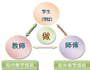
图8 “教学做合一”教学模式

二是实施“教学做合一”教学模式改革。即通过坚持以“做”为核心，完善“校内、校外”两情境，突出“教师、师傅、学生（学徒）”三主体，实施“做什么、怎么做、动手做、反思做”四环节，推动课堂教质量的提升。