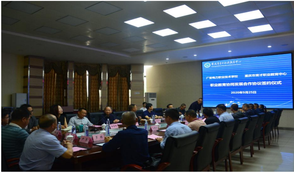
图 14 与广安电力职业技术学校签署协同发展协议