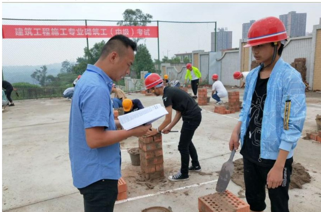
图 4 砌筑工(中级)考试现场

学校积极开展学生职业技能培训，本年度培训与鉴定学生总规模达 2859 人，其中 2020 年秋期学生培训与鉴定人数达 1480 人，2021 年春期学生培训与鉴定人数为 1379 人。