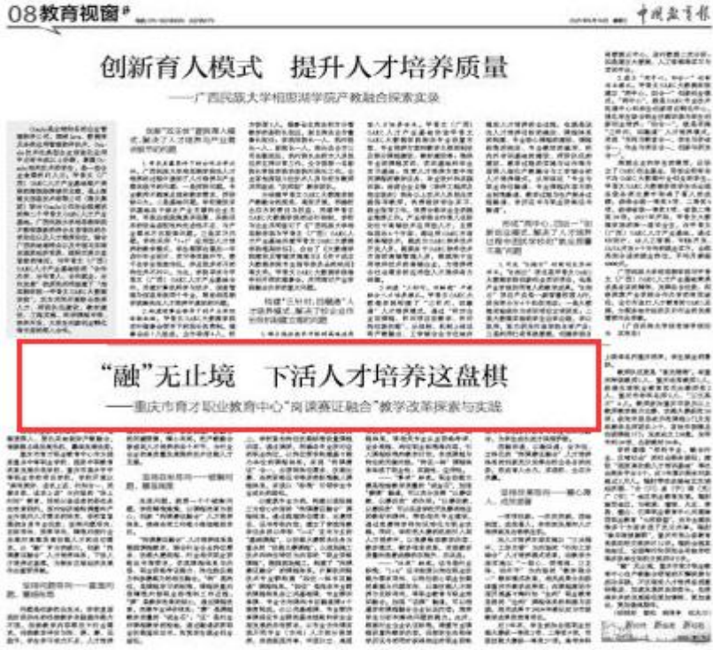
图 13 中国教育报报道“岗课赛证融合”教学改革

办学成果宣传方面。 本学年度，学校在中国教育报、中新网、重庆日报、重庆电视台等国家级、市级媒体上进行宣传报道 11 次；在合川日报、合川电视台等区级媒体上进行宣传报道超过 30 余次；在学校官方网站、微信公众号、抖音等平台实时更新，高质量宣传办学成果及改革成效。