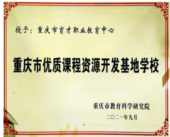
图 3 重庆市优质课程资源开发基地学校