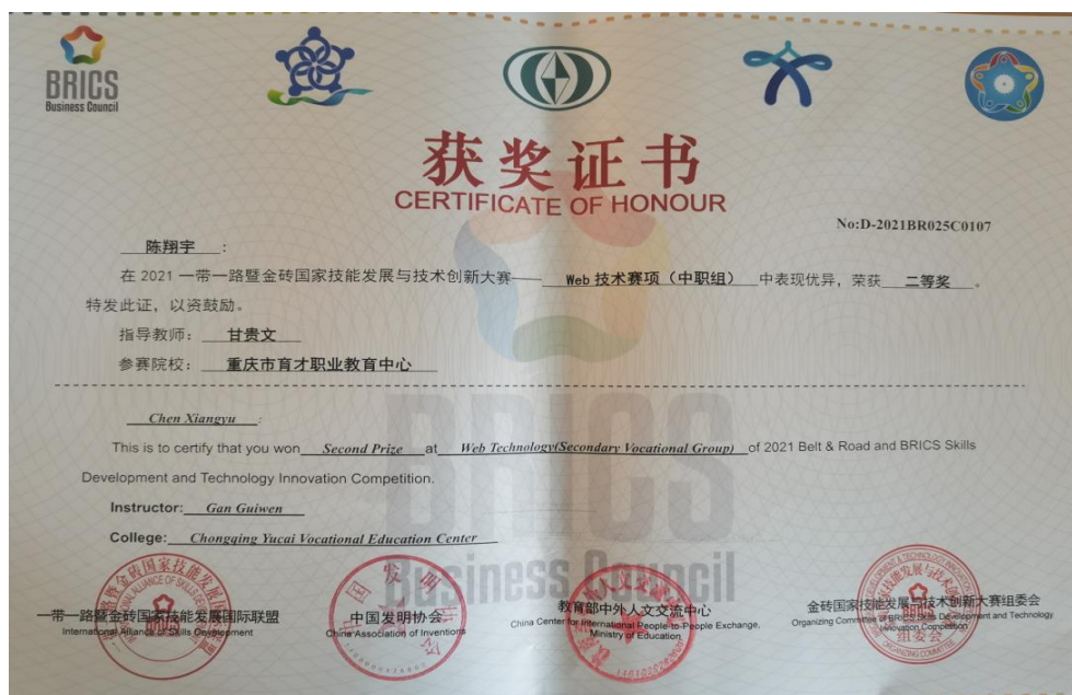
图 20 学生参加一带一路金砖国家技能发展与技术创新大赛获奖证书