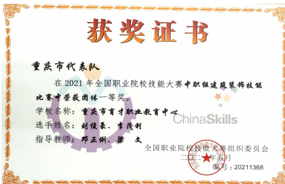
图 18 学生参加职业院校技能大赛获全国一等奖