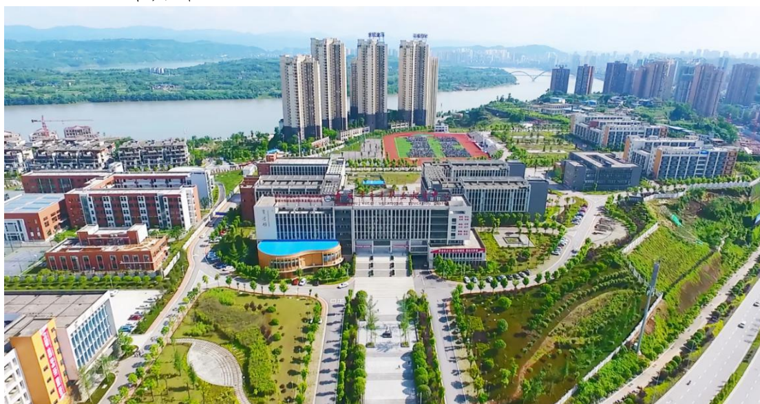
图 1 学校鸟瞰图

重庆市育才职业教育中心是国家级重点中等职业学校、国家中等职业教育改革发展示范学校、国家级高技能人才培训基地，重庆市高水平中等职业学校项目学校、重庆市“双优”项目学校。学校由重庆市合川区人民政府举办，并由合川区教育委员会主管。学校位于合川区钓鱼城街道办事处花滩大道2号，占地214907平方米，建筑面积120390.25平方米。