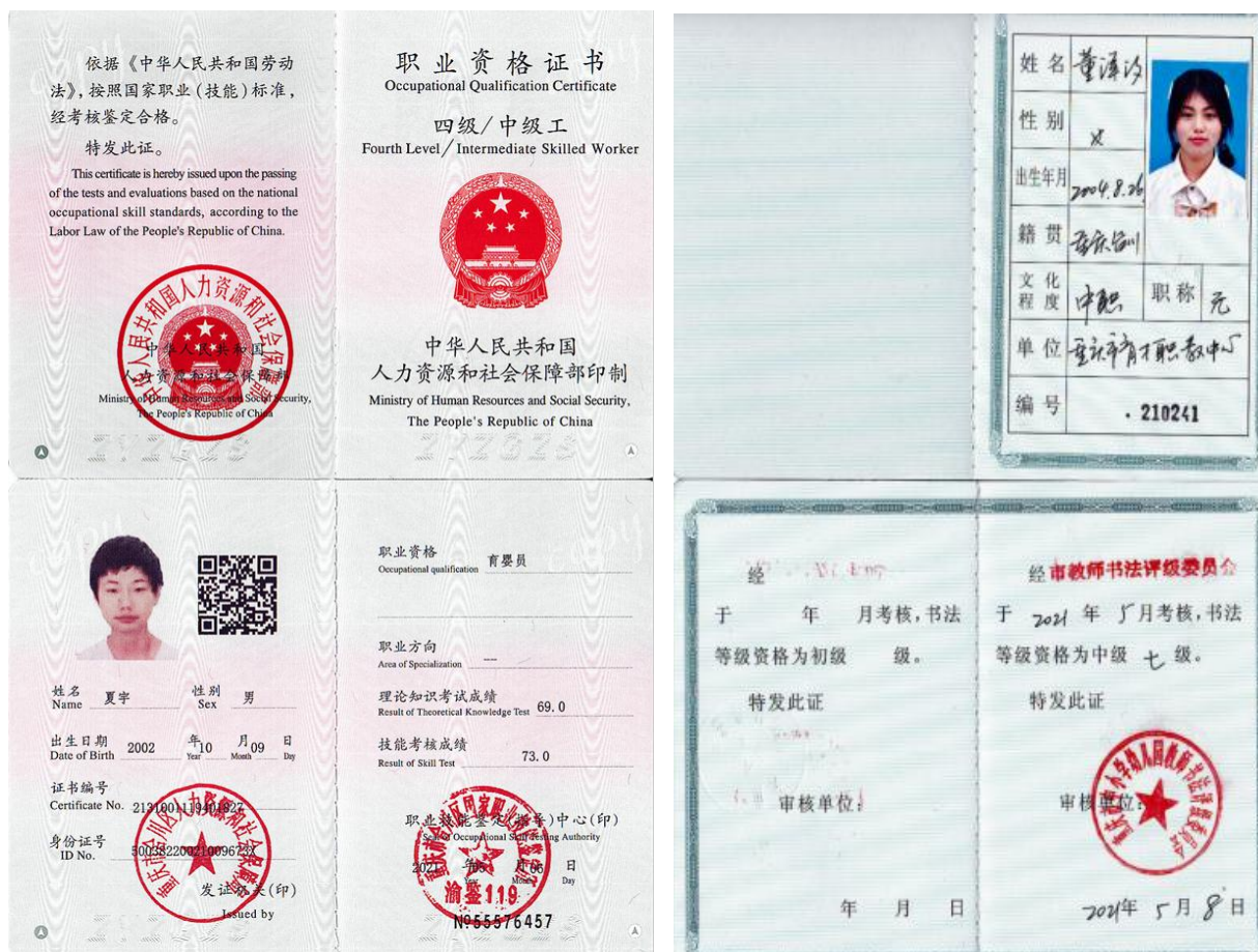
图 7 学生职业资格证书 (部分)

2020-2021 学年度, 学生公共基础课合格率达 88.68%, 专业技能合格率达 86.73%, 体质健康测试合格率达 92.7%, 毕业率达 87.01%, 开展了电工、保育员等职业技能鉴定, 通过率达 90%。学校开展了“汽车运用与维修”“幼儿照护”2 个职业技能等级证书的培训和考试工作, 计划人数 196 人, 考取证书 191 人, 证书获取率 97.45%。