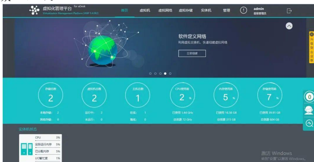
图 6 虚拟化管理平台

学校持续投入，进一步升级打造了校园电视台、多媒体教室、视频监控系統、校园广播系統等。加强信息化基础设施建设，出口带宽增加到 700M，引入壹教云数字校园系統，建成了办公 OA 系統、数字化校园平台、学生综合素质评价系統、学校官网后台管理系统、重庆市中职学籍管理系统、全国中职学籍管理系统、壹教云数字校园等 7 个信息系統，进一步加强了学校信息化管理，改善了学生和教職工的信息化使用体验。同时，学校加强网络安全人防、物防、技防。投入 108.6 万元购置了网络安全产品，进一步加强校园网络的防护能力。与 360 网络安全有限公司开展合作，购置了企业版杀毒软件，更加科学高效维护校园网络安全环境。学校现有多媒体教室 237 间，占教室总数 98.01%。