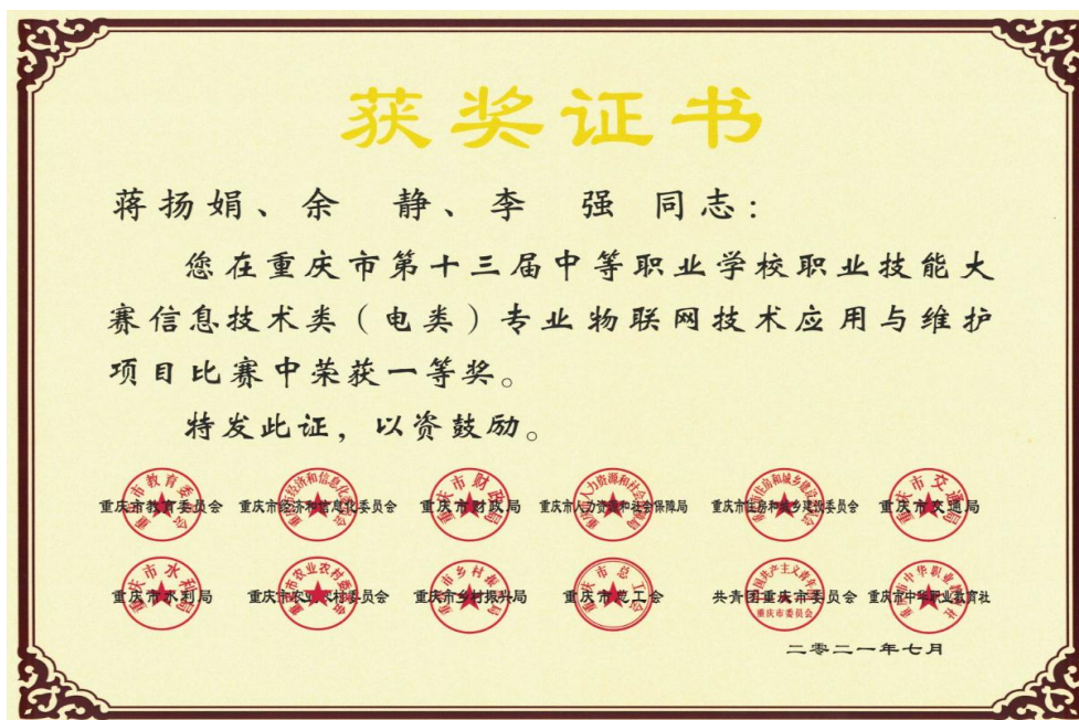
图 17 教师职业技能大赛市赛一等奖证书