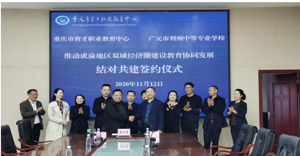
图 15 与广元市利州中等专业学校签署协同发展协议